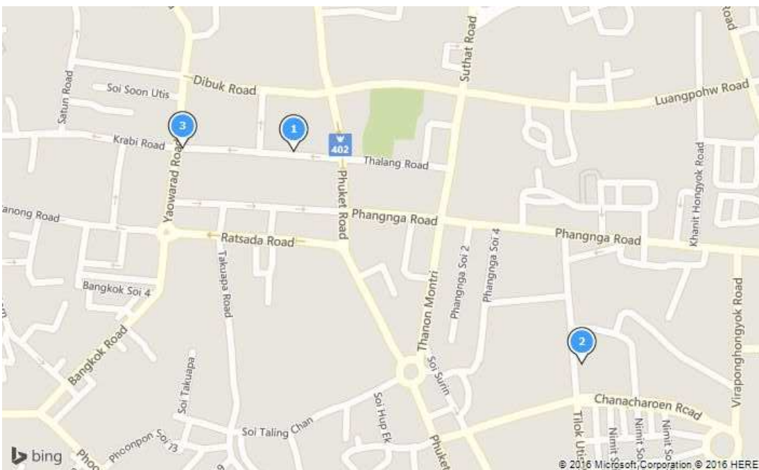
Lugares donde comer en Phuket

92/1 Phangna Road, Talat Yai, Phuket town. 83000 , Phuket